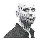
door Rik Goverde