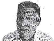
door Toine van Berkel